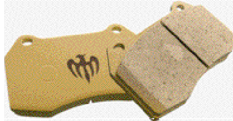
スポーツブレーキパッド