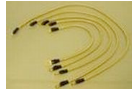
アースングシステム

16L.E.Dで驚くほど室内が明るくなる！オシャレな内装が良く見えるようになる！