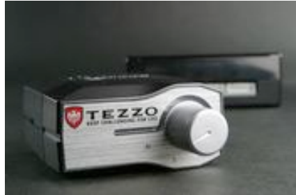
スロットルコントローラー