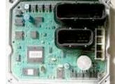
DTT-ECU スポーツコンピューター

ブレーキダストが少ないのにコントロール性がアップ！ホイールがキレイだとオシャレ！