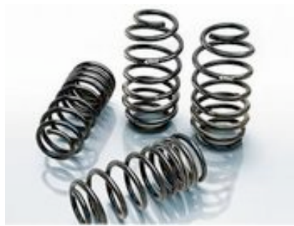
ダウンスプリング