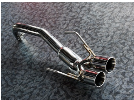
スポーツマフラー