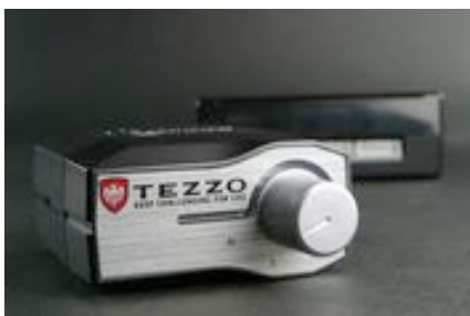
スロットルコントローラー