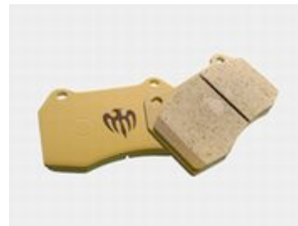
スポーツブレーキパッド